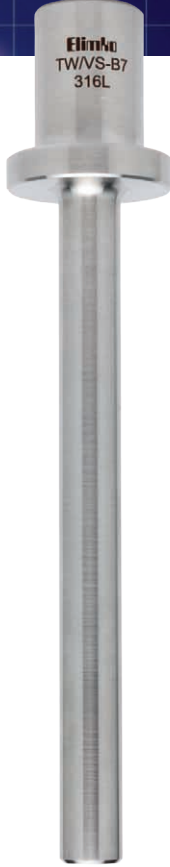
TW/VS Vanstone Flanşlı Tip Düz Thermowell