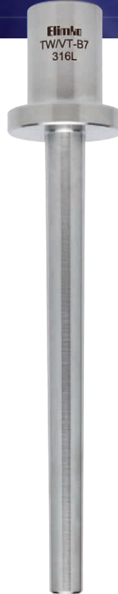
TW/VT Vanstone Flanşlı Tip Konik Thermowell