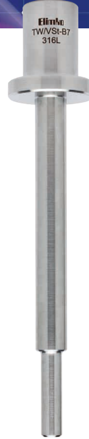
TW/VSt Vanstone Flanşlı Tip Kademeli Thermowell